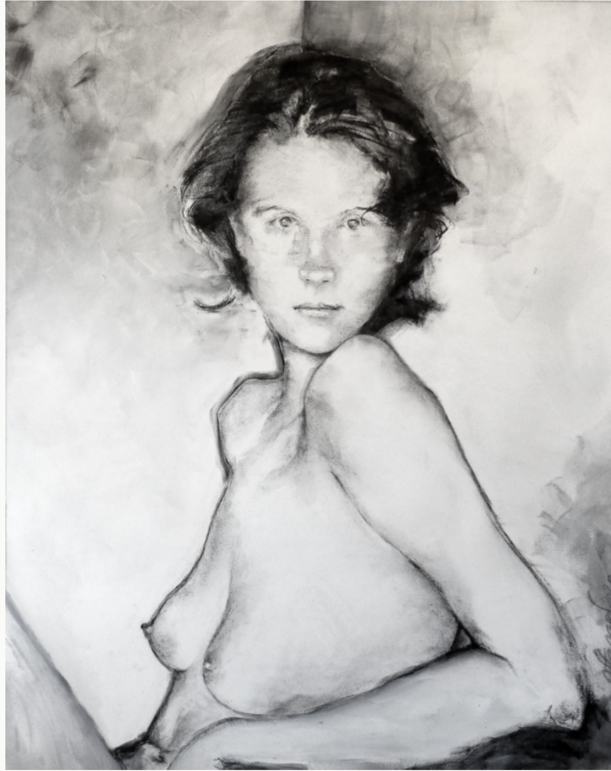
Male woman - 2020 Acrylique et fusain sur toile Série "An own gender inside" 81 x 100 cm