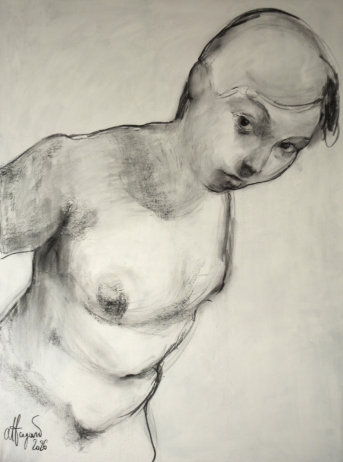
Renée - 2026 Fusain sur toile 97 x 130 cm