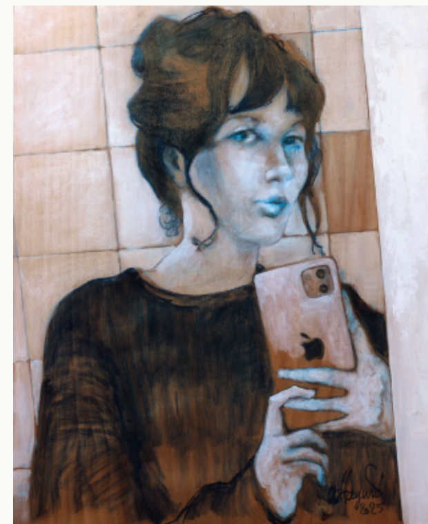
Selfie au miroir 17 - 2025

Acrylique fusain et crayon de couleur sur bois 100 x 200 cm