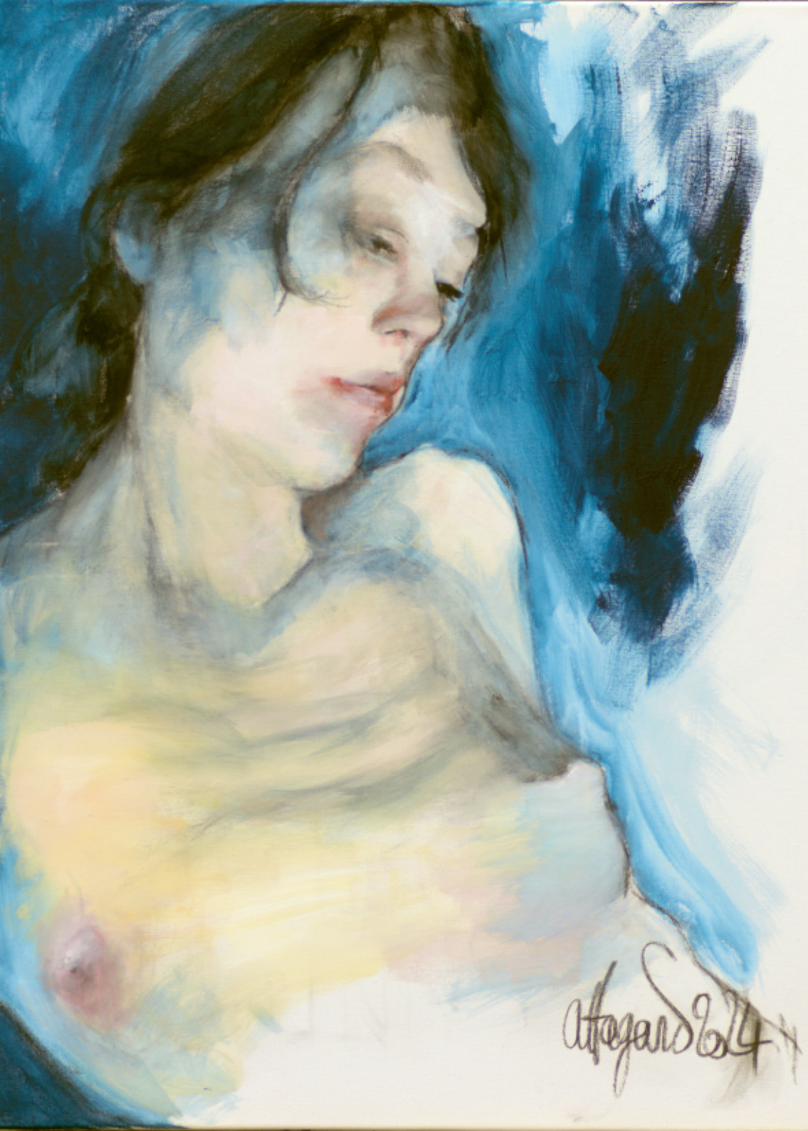
Sorrow - Vilidian - 2024 Acrylique sur toile 60 x 80 cm