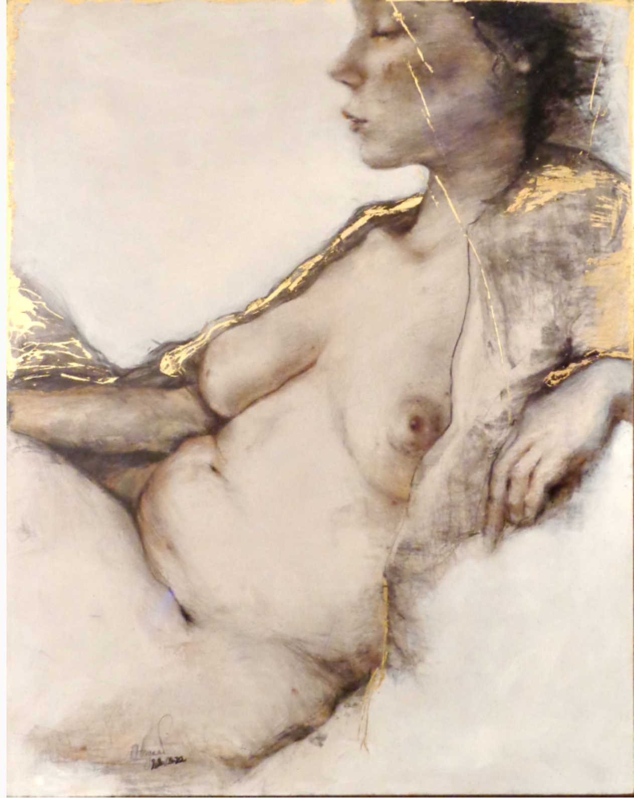
Mother died - 2022 Acrylique, fusain et cuivre sur bois 100 x 130 cm Collection privée