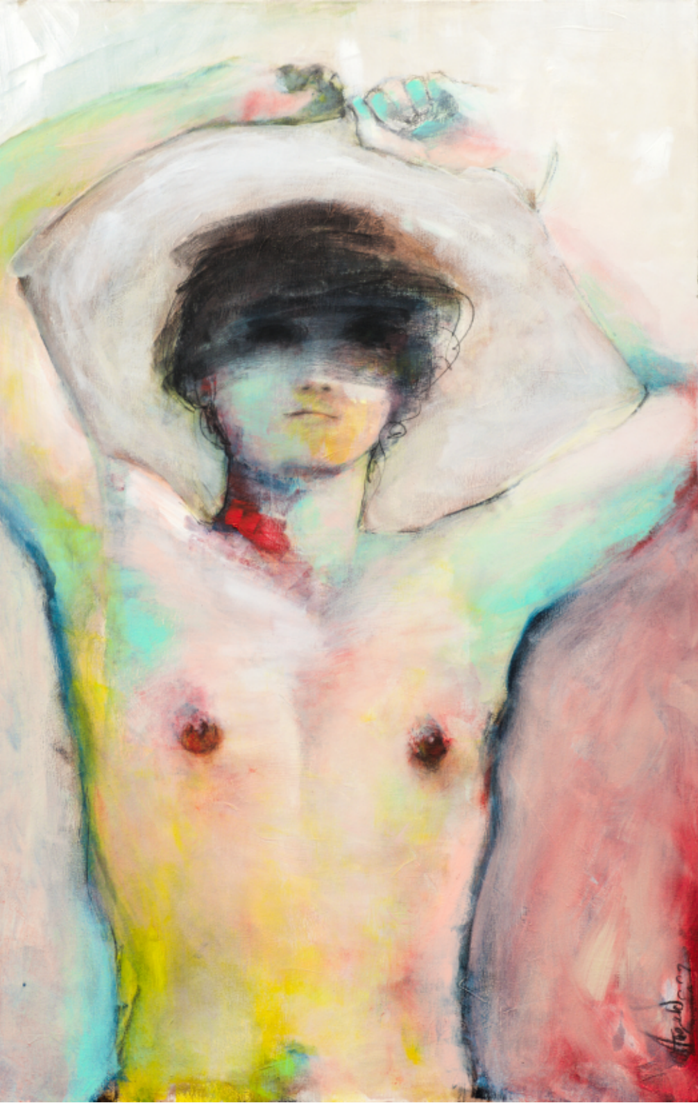
My censored male inside - 2022 Série "An own gender inside" Acrylique et fusain sur toile 75 x 115 cm