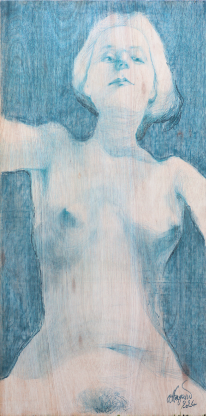
Woman on wood 19 - Elena - 2024 Craie et crayon de couleur sur bois 61 x 122 cm